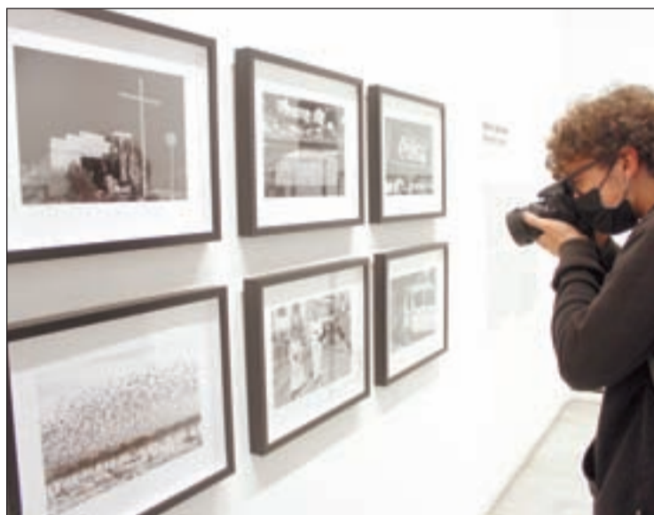
La mostra es podrà visitar fins al 24 d'abril

La mostra és el resultat del treball conjunt entre les institucions i després, les obres es quedaran a l'equipament, que tal com va confirmar Navarro, té garantida la nova seu en construcció a Rambla Ferran després d'assolir el compromís d'obra fixat per no perdre els ajuts Feder. Navarro va destacar l'esforç "important"