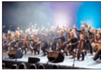
Unes 7.000 persones han vist ja l'espectacle

El 'Christmas & Hits' de l'Orfeó Lleidatà torna a la Llotja