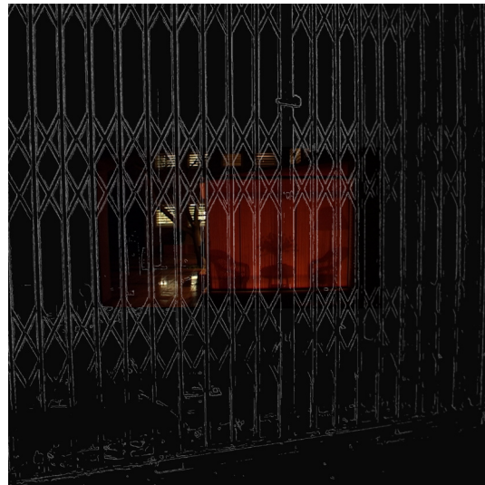
Simulació; videoinstal·lació. Simulación; videoinstalación. Simulation; video installation. Simulation; installation vidéo.