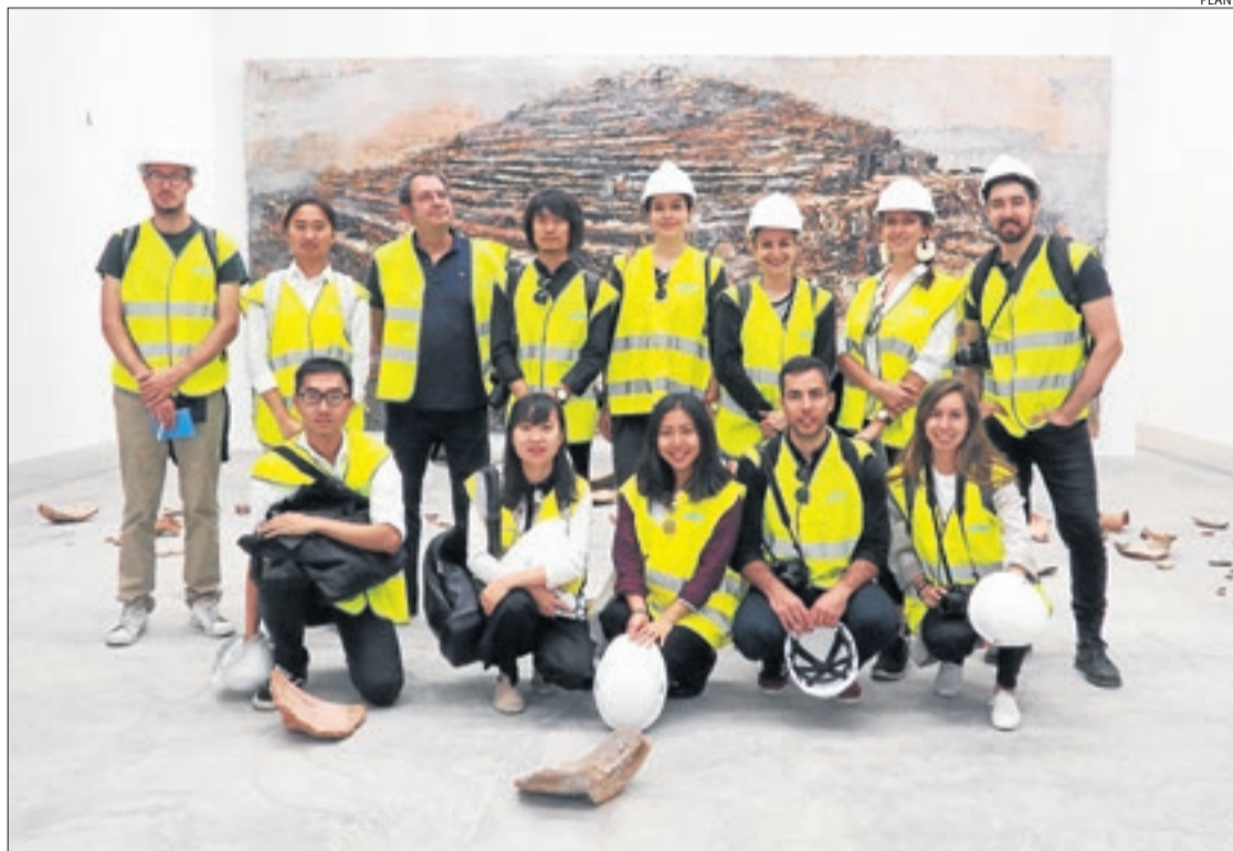
Estudiants de Harvard al Kiefer Pavilion, el primer 'site specific' de Planta, dedicat a Anselm Kiefer.

El 15 de setembre passat es va presentar el nou projecte de Planta en la biennal de Chicago